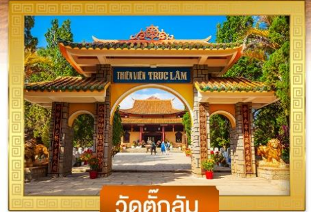
วัดตึกลิ้ม