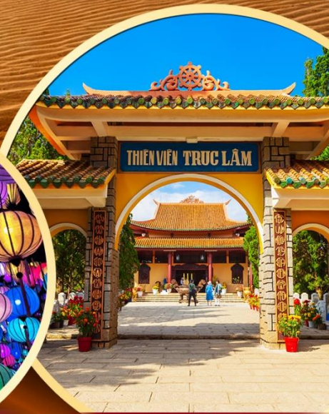
วัดตักลับ